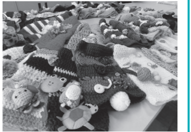
かわいく飾りつけされたマフにほっこり♡